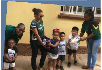
Inzamelingsactie voor slachtoffers van de overstromingen op Zarah's school